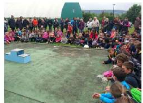
Cross des écoles