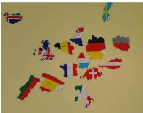
Découverte de l'Europe par les CP avec Céline.