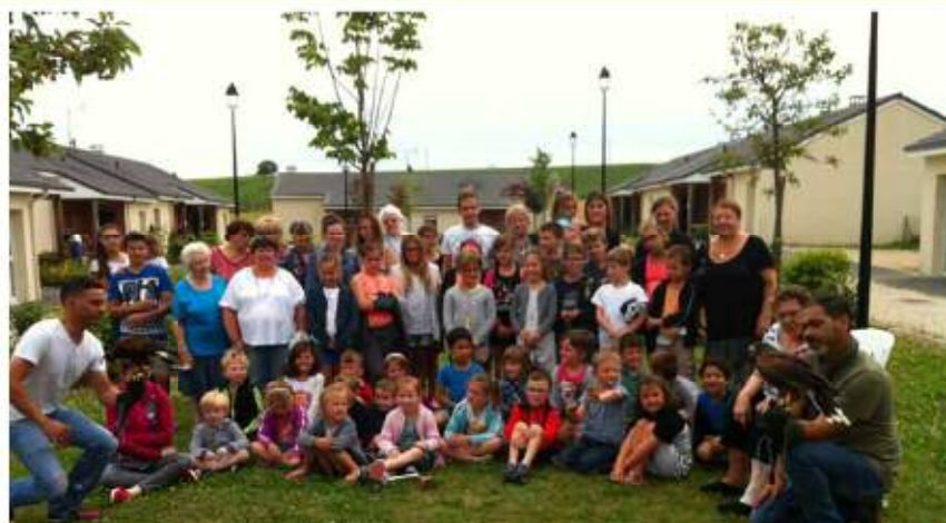
Démonstration de rapaces devant les seniors au Clos des Carelles