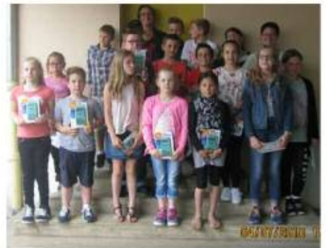
Remise des caleulettes