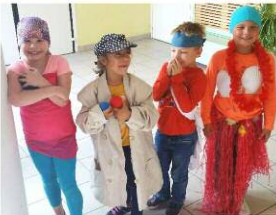
Spectacle imaginé et réalisé sur le temps de garderie par les enfants : une voyante qui ne voit pas grand-chose, un jongleur qui perd la boule, un karatéka sans souplesse et une Vahiné.

CIToyenneté/INTERGÉNÉRATION - découverte de l'Europe - la déclaration universelle des droits de l'enfant - prévention environnement - activités avec des personnes d'une autre génération.