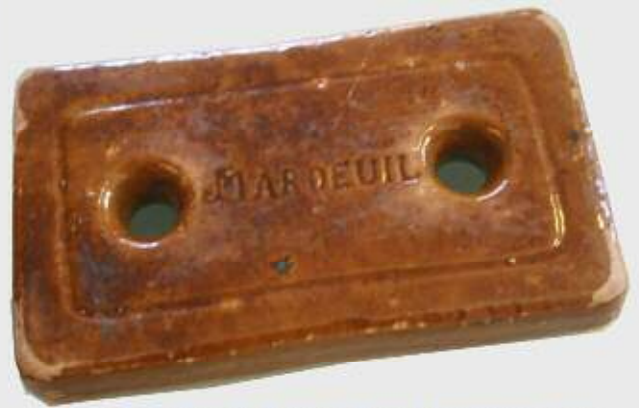
Chauffeuse vernissée, terrines, pots à escargots, plats...

La cheminée a perdu la moitié de sa hauteur en février 1996. Elle servait de repère pour l'aviation.