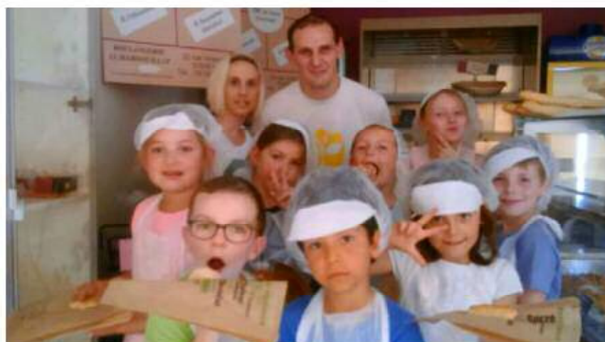
Chez le boulanger, les enfants ont confectionné des pains au chocolat.