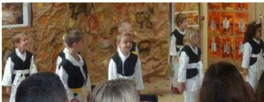
Kermesse de la maternelle