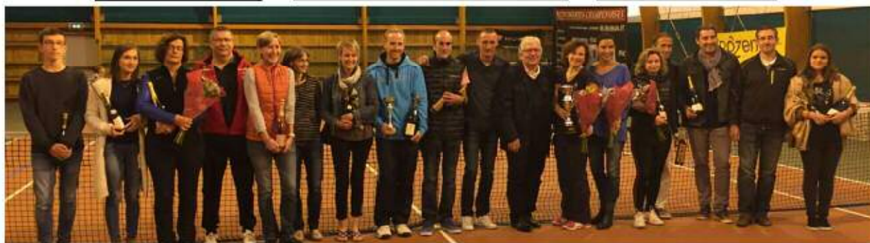
Joueuses et joueurs récompensé(e)s lors du 9 è tournoi du TC Mardeuil